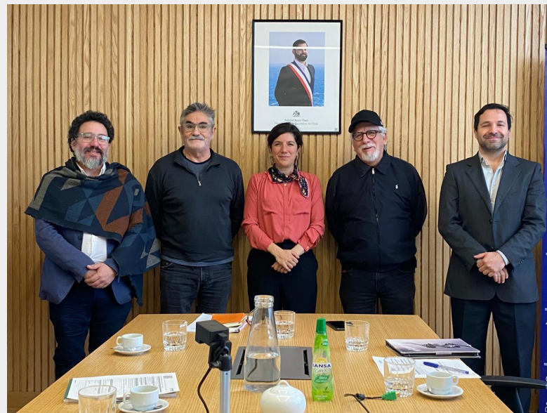
9 DE OCTUBRE, 2024 Ministra de Ciencia, Tecnología, Conocimiento e Innovación, Aisén Etcheverry.