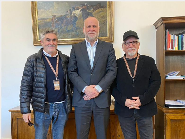
12 DE SEPTIEMBRE, 2024 Ministro Secretario General de la Presidencia, Álvaro Elizalde.