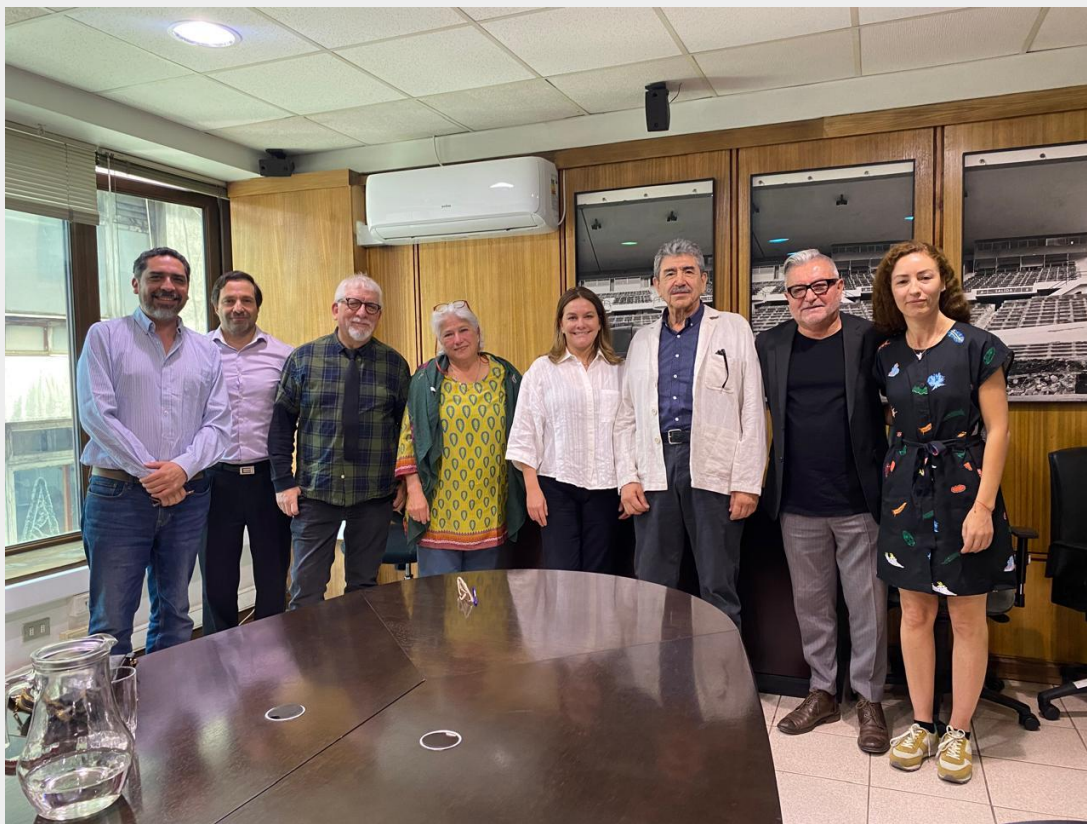
9 DE DICIEMBRE, 2024 Reunión con Subsecretaria de las Culturas y las Artes, Jimena Jara .